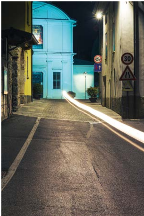
Emilio Corbari - Avvistamento n. 4 - Viana Chiesa di San Rocco