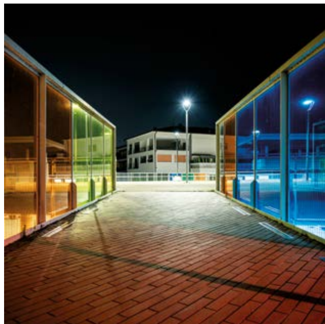
Sergio Adobati - Notturmo nembrese