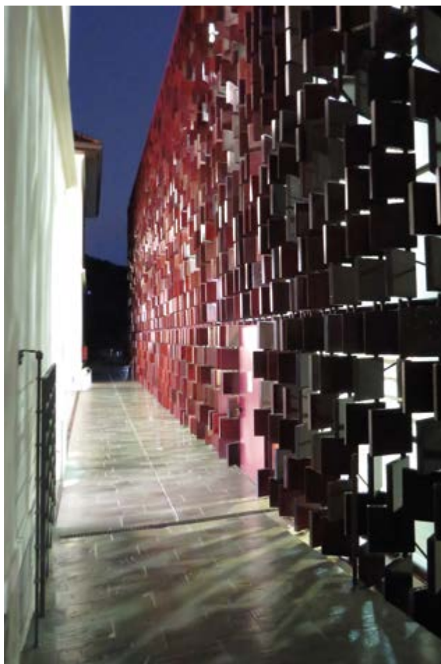
Fabrizio Masseroli - L'altra faccia della cultura