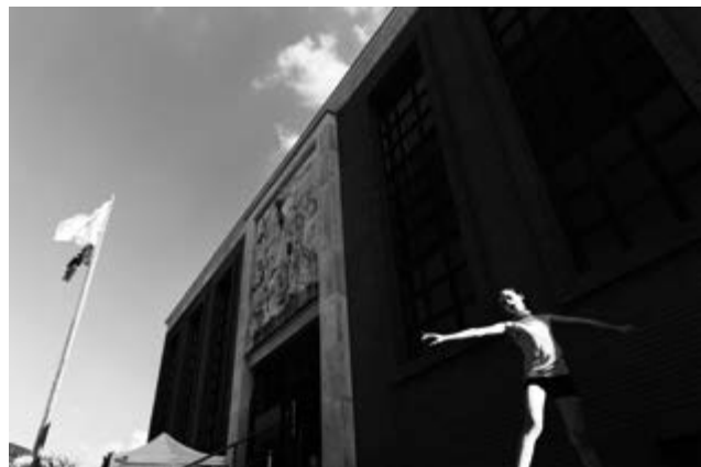
Anica Zanetti - Piazza della Libertà

Gli incontri riprenderanno il 4 settembre 2025